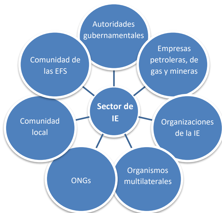
Figura 2: Visión general de los principales actores e interesados en el sector de las industrias extractivas